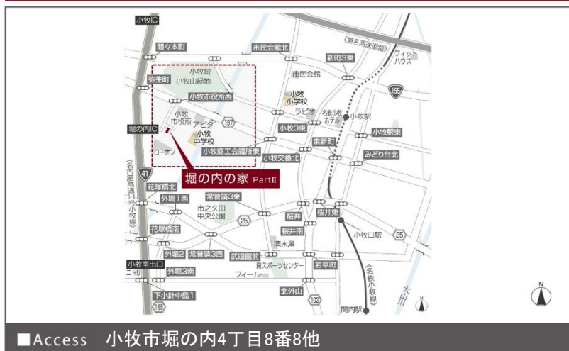
Access 小牧市堀の内4丁目8番8他